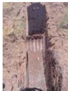
Fig. 3 Calicata en zona de la balsa, yesos masivos.