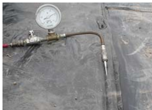
Fig. 5 Control de soldadura de su estanqueidad, mediante aire