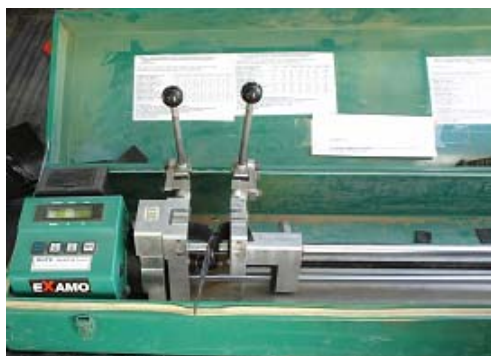
Fig. 4 Control de soldadura, pelado

En la actualidad en el mercado español se vienen aplicando de forma casi generalizada, el protocolo de ensayos más exigente, que es el aplicado a la impermeabilización de vertederos de residuos sólidos peligrosos y que va desde el control de las láminas en origen en cuanto a características físicas como de envejecimiento o resistencia química, hasta el control del 100% de las soldaduras mediante pruebas de aire o de pelado y a la trazabilidad del material, identificando la situación de cada rollo en la obra. Se completa en los casos de máxima exigencia, con la aplicación de estudios geofísicos de la estanqueidad.