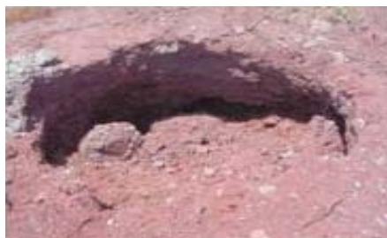
Fig. 2 Colapsos de arcillas sobre sustrato de yesos