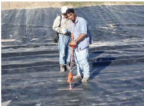
Fig. 6 Control de impermeabilidad, detectando fugas, mediante dispositivo VATEM (Verificador de alto voltaje electromagnético)